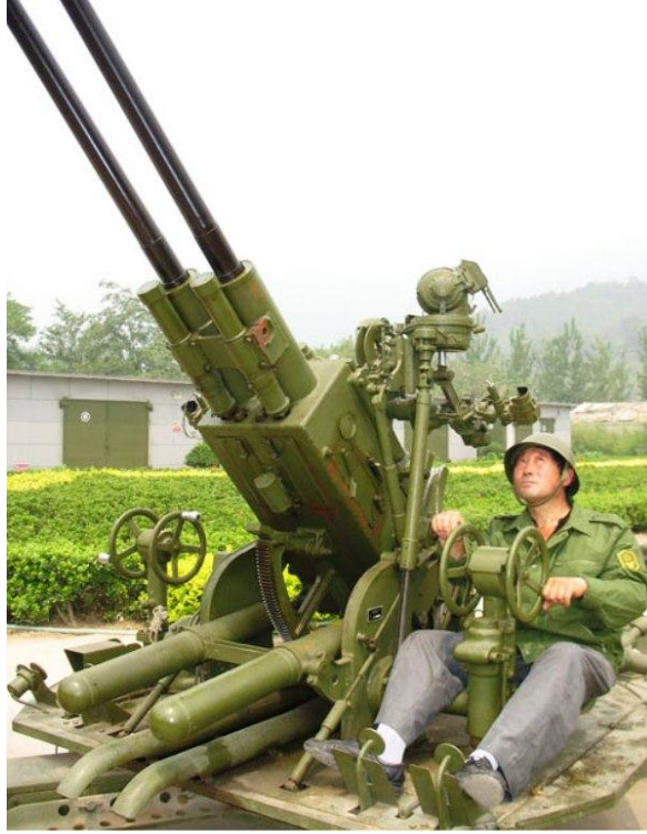
استخدام المدفعية المضادة للطائرات لإطلاق مواد التلقيح إلى مستوى السحب

حجم قادر على التغلب على حركات الهواء الصاعد ، تكتسب سرعة سقوط مناسبة وتستمر في النمو أثناء سقوطها عن طريق تجميع قطرات لغيوم التي تصادفها أثناء سقوطها إلى أسفل (الاستمطار في الإسلام د ياسين محمد الغادي http://www.almoslim.net/node/84368 ).