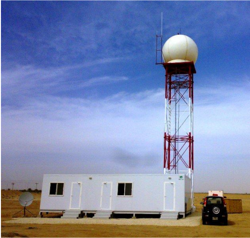
صورة لرادار دوبلر المخصص لمراقبة السحب المستهدفة للاستمطار