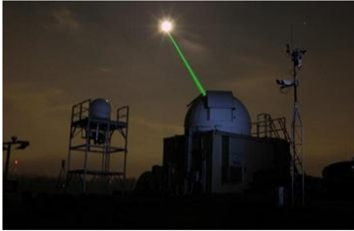
صورة توضح استعمال الليزر في الاستمطار (٢)