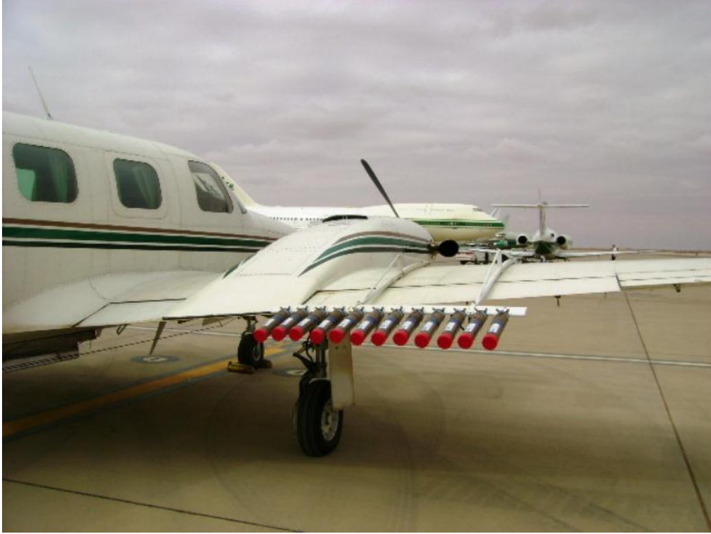
صورة للطائرة المعدة للاستمطار

- كطائرات ذات مواصفات خاصة : تتمكن من التحليق أعلى قمم السحاب، وأن تكون مجهزة بوسائل إطلاق مواد الزرع، ونظام جمع وتحليل المعلومات ، التي يتم جمعها من أجهزة القياس المركبة على طائرات الاستمطار، ومحطات رادار الطقس .